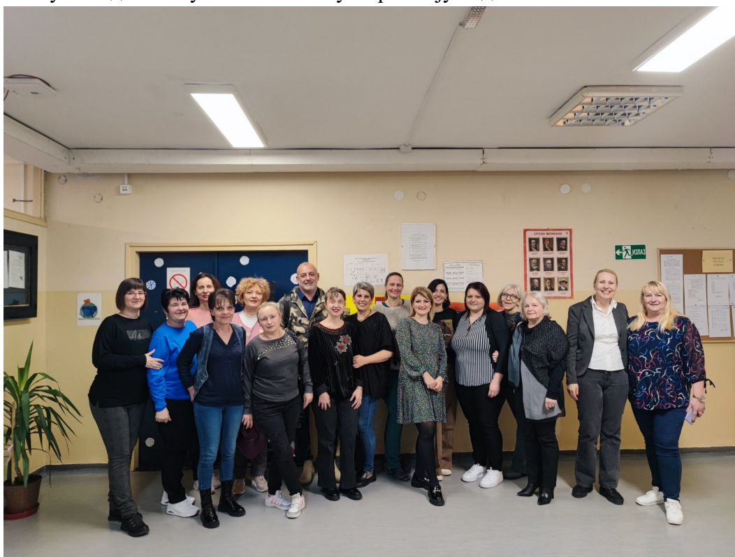
Наставничко веће Школе за о.о.о. Младеновац са гостима из ОШ «Бранко Пешић»

Чланови колектива наше Школе свакодневно настоје да допринесу бољем, квалитетнијем и ефикаснијем раду установе. Квалификациона структура запослених радника усклађена је са потребама Школе, а кроз различите семинаре и обуке, наставном особљу и стручним сарадницима сваке школске године је омогућено да стекну нова знања и усавршавају педагошке способности.