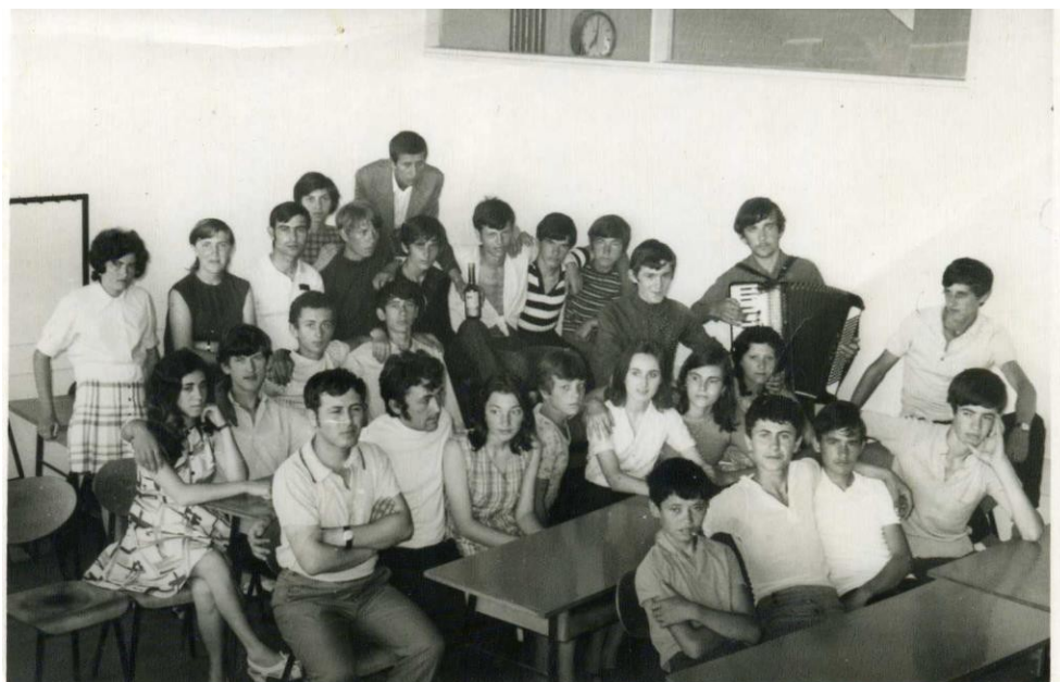
Седамдесете године 20. века

Темељи Школе за основно образовање одраслих Младеновац постављени су 30. марта 1967. године када је Скупштина Општине Младеновац донела Решење о оснивању Народног универзитета у Младеновцу. Наредне године, Народном универзитету у Младеновцу припојен је Раднички универзитет, а 1970. године основано је одељење за основно образовање одраслих.